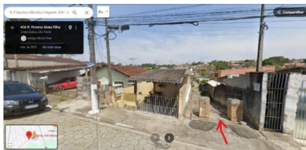
Localização do trecho no Google Maps