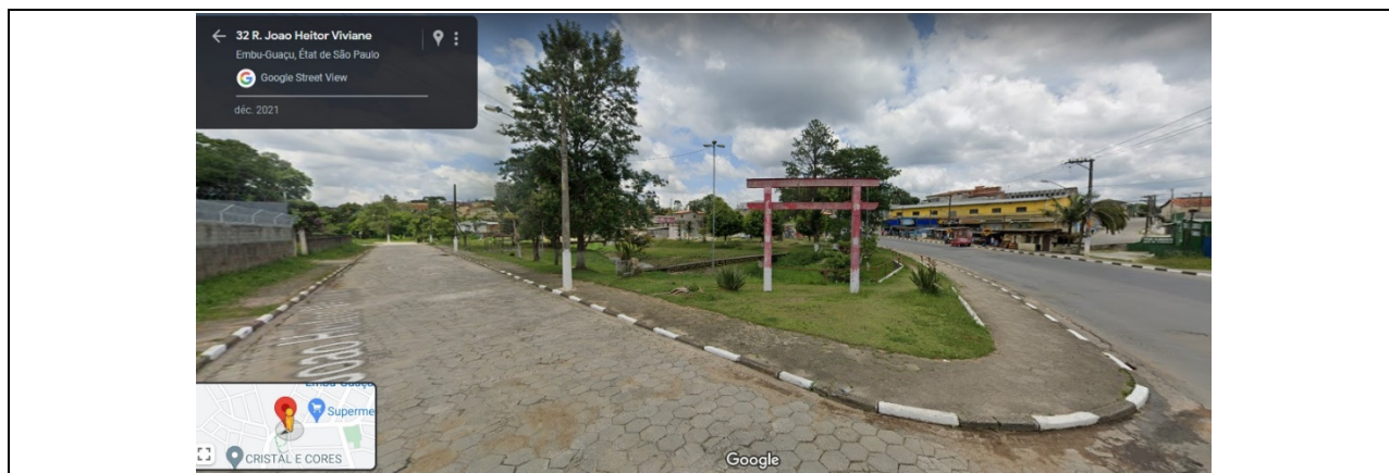
Figura 3- Rodovia José Simões Louro Junior, nº 431, Jardim Madalena.

O espaço que hoje se destaca pela presente moção, situa-se na Rodovia José Simões Louro Junior, nº 431, bairro Jardim Madalena: