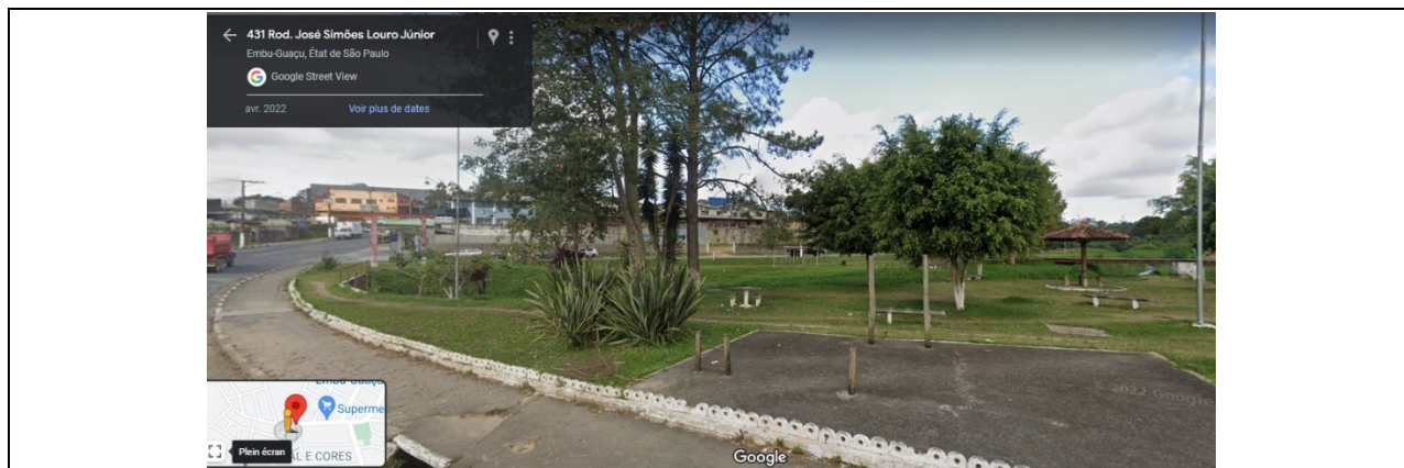
Figura 4- Rodovia José Simões Louro Junior, nº 431, Jardim Madalena.

Acredita firmemente, este Vereador, que um olhar acurado da municipalidade sobre as fotos acima destacadas pode desencadear vários projetos de revitalização da cidade de Embu Guaçu, começando pelo número 431 da Rodovia José Simões Louro Junior, que possui todas as qualidades para se tornar a primeira janela de apresentação de tudo de belo que a cidade de Embu Guaçu pode vir a ser.